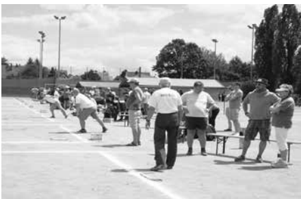
Deutsche Meisterschaften 2014 auf dem FSV-Gelände

JÖRG LAECHELIN, Öffentlichkeitsarbeit NPV